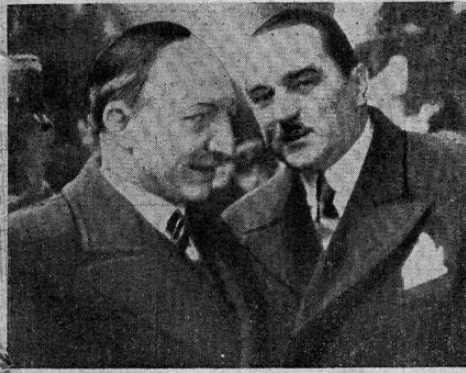
A su llegada a Belgrado el Sr. Delbos fué recibido en la estación por el Presidente del Consejo yugoslavo Sr. Stoyadinov

Tropas españolas son las que toman parte en la ofensiva de Aragón.