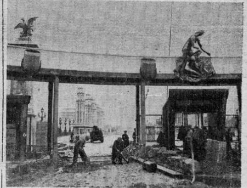
Después de la clausura de la Exposición de Artes y Oficios, el edificio Alejandro III ha sido de nuevo abierto a la circulación y los obreros activan la reparación de las aceras.

BURGOS, 17. — Las divisiones de los generales Yagüe y Valhona, la primera avanzando por la carretera a lo largo del río Ebro y la segunda marchando desde Alcañiz después de la captura de dicha ciudad, fueron las que completaron la captura de Caspe, siendo el propio generalísimo Francisco Franco quien dirigió las operaciones, y con órdenes a las tropas de evitar hasta donde fuera posible la destrucción de la población. Los milicianos ofrecieron una resistencia desesperada en el hospital de Caspe, como también en el castillo a dos kilómetros al sur de la ciudad. En este formidable baluarte las tropas republicanas lucharon heroicamente por horas, pero, al mismo tiempo, los bosques de olivos que lo rodean. Sin embargo, confrontado el moderno equipo de artillería y tanques de las fuerzas atacantes, los gobiernos de Caspe, una vez que tras de la otra, y la infantería nacionalista tomó al asalto las alturas estratégicas que dominan Caspe. Un convoy rojo compuesto de camiones blindados y tanques cayó en posesión de los vencedores, junto con un grupo de funcionarios gubernamentalistas de la ciudad.