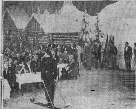
Durante una original fiesta celebrada en París, los cazadores alpinos del ejército francés tomaron parte en ella con diversas exhibiciones. Uno de los concurrentes recibiendo las felicitaciones del público.

ha hecho más que el simple papel de agente del gobierno republicano español, y para terminar esta información, "podemos asegurar lo siguiente: esas cédulas de la deuda de Costa Rica para con los banqueros españoles, "no han salido de España"; allí están, en poder del gobierno de Barcelona, por incautación que de ellas hiciera en los Bancos a los que pertenecen. Es todo lo que hay de cierto en estos asuntos.